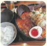
あやとさん ・公立小学校教員

1996年生まれ。9歳から18歳まで東京都内の児童養護施設で過ごす。高校卒業後、静岡大学に入学。1年間の休学期間を経て、大学卒業後は厚生労働省に入省する。現在は厚生労働事務官として血液行政に携わる。