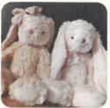
なのさん ・アパレルショップ副店長

1998年栃木県生まれ。18歳までを児童養護施設で過ごす。中学から大学まで柔道部に所属。宇都宮大学卒。在学中は児童相談所一時保護課で嘱託員として3年間勤務。21年頃から小学校の教員となる。趣味は外食。